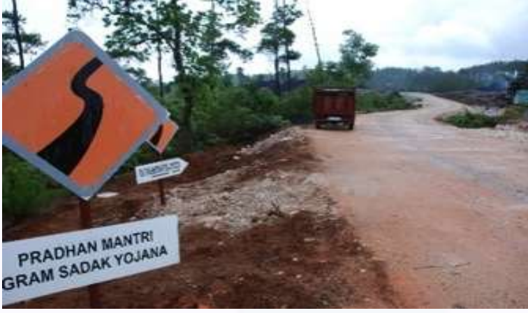
ಅಂತರ ಗ್ರಾಮ ರಸ್ತೆ / ಹತ್ತಿರದ ನಗರ ಕೇಂದ್ರಕ್ಕೆ ಸಾರ್ವಜನಿಕ ಸಾರಿಗೆ ಸಂಪರ್ಕ