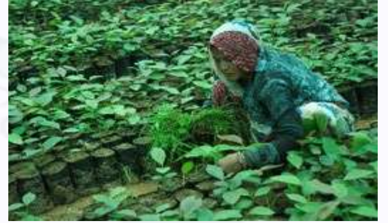
ಸಾವಯವ ಕೃಷಿ / ಕೃಷಿ ಸಂಸ್ಕರಣೆ / ಕೃಷಿ ಸೇವೆಗಳು