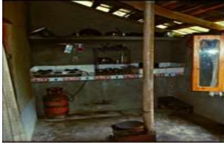
ಎಲ್ವಿಜಿ ಅನಿಲ ಸಂಪರ್ಕ ಕಲ್ಪಿಸುವುದು.