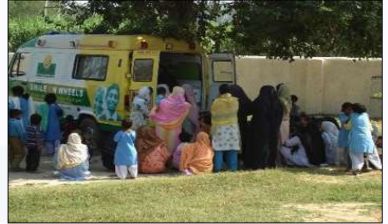
ಸಂಪೂರ್ಣ ಸುಸಜ್ಜಿತ ಮೂಬೈಲ್ ಆರೋಗ್ಯ ಘಟಕ.