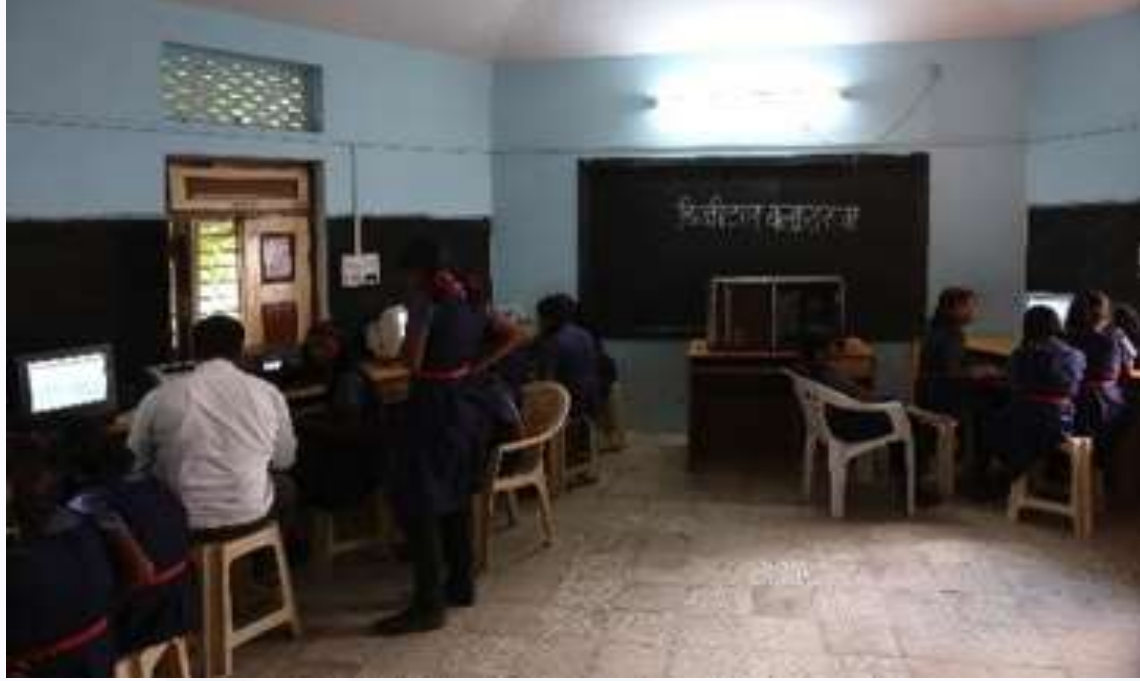
ಸಂಪೂರ್ಣ ಡಿಜಿಟಲ್ ಸಾಕ್ಷರತೆ ಮತ್ತು ಇ- ಗ್ರಾಮ ಕೇಂದ್ರ