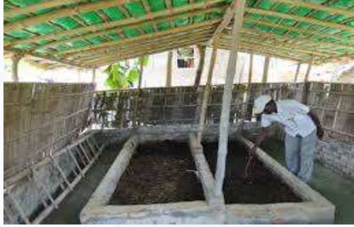
ಘನತ್ಯಾಜ್ಯ ಸಂಸ್ಕರಣೆ/ವರ್ಮಿ ಮಿಶ್ರಗೂಬ್ಬರ ಸಾವಯವ ಸಂಸ್ಕರಣೆ