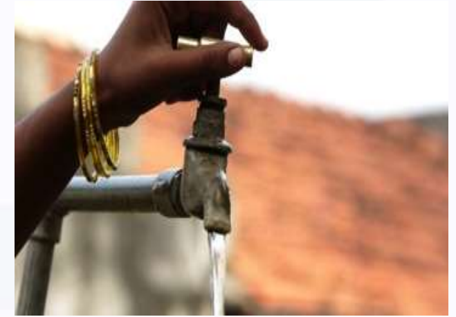
24x7 ನೀರು ಸರಬರಾಜು