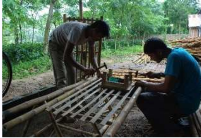
ಕೌಶಲ್ಯ ಅಭಿವೃದ್ಧಿ ತರಬೇತಿಗಳನ್ನು ಆರ್ಥಿಕ ಚಟುವಟಿಕೆಗಳೊಂದಿಗೆ ಲಿಂಕ್ ಮಾಡುವುದು.