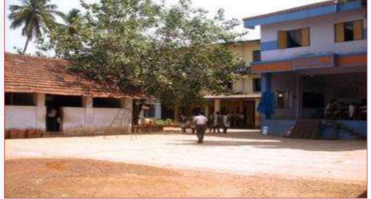
ಪ್ರಾಥಮಿಕ, ಮಾಧ್ಯಮಿಕ, ಮತ್ತು ಪ್ರೌ.ಡ ಶಾಲೆಗಳ ನವೀಕರಣ